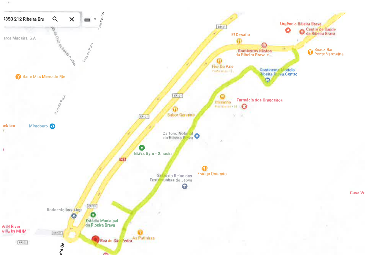
Figura 1 – Percurso assinalado a verde.

*Com competências delegadas e subdelegadas por despacho de 25 de Outubro de 2021, publicado pelo Edital 287/2021