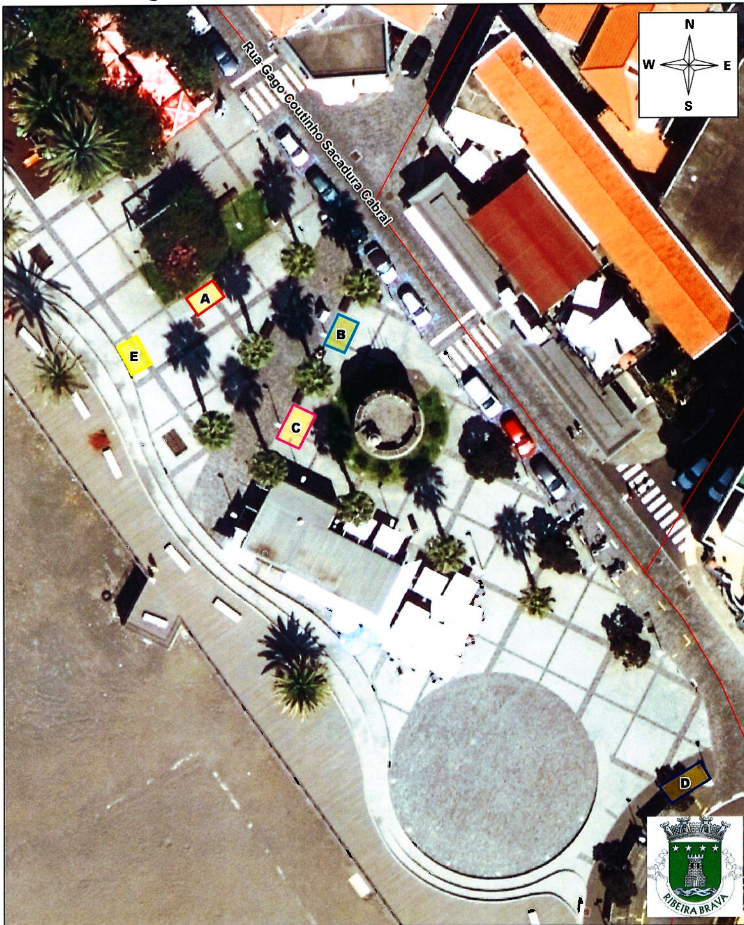
Planta de Localização - Ortofotomapas 2019

LEGENDA: LOCALIZAÇÃO BARRACAS - NATAL - 2022